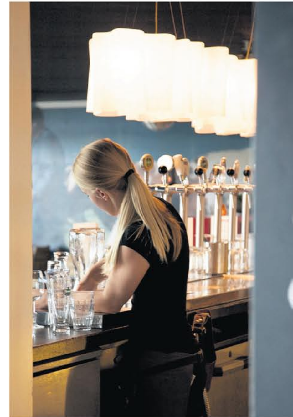
Uitgaan op IJburg, een serveerster van Blok 4 aan het werk.

En natuurlijk heeft IJburg Blijburg, de strandtent die de nieuwe wijk in heel Amsterdam op de kaart heeft gezet. Hoewel het bedrijf van